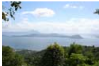
Taal, vue d'ensemble